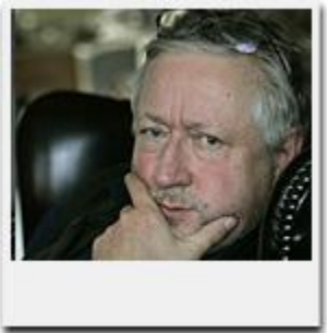
Leif GW Persson